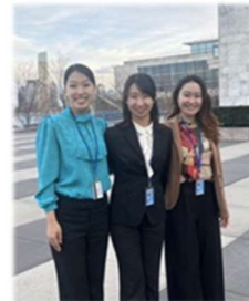
次世代とともに・CSW68 インターン